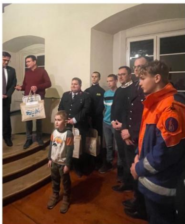
Übergabe der T-Shirts an die Feuerwehren

Im Rahmen mehrerer kleinerer Veranstaltungen wurden im Dezember die T-Shirts der Aktion für Kinder- und Jugendfeuerwehren im Gebiet des LAG Naturpark Saale-Unstrut-Triasland e.V. übergeben.